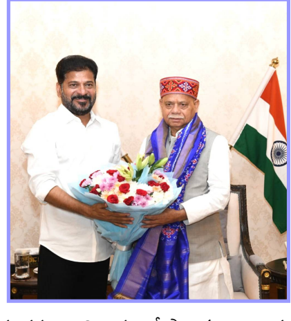
సందర్భంగా విద్యార్థులతో పొగాకు, మద్యం, మాదకద్రవ్యాలకు వ్యతిరేకంగా ప్రత్యేక ప్రతిజ్ఞ చేయించనున్నట్లు ముఖ్యమంత్రి అనుమల రేవంత్ రెడ్డి

వెల్లడించారు. ఈ మేరకు ఆయన రాష్ట్ర గవర్నర్ శివప్రతాప్ శుక్లాతో లోక్భవన్లో మర్యాదపూర్వకంగా భేటీ అయ్యారు. ఈ విద్యా సంవత్సరం నుంచి పాఠశాలల ప్రారంభం రోజునే విద్యార్థులకు వివిధ వస్తువులతో కూడిన స్కూల్ కిట్లను పంపిణీ చేయనున్నట్లు ముఖ్యమంత్రి తెలిపారు. యూనిఫాంలు, పాఠ్యపుస్తకాలు, నోట్బుక్స్, స్కూల్ బ్యాగ్, క్రీడా దుస్తులు, ఇతర అవసరమైన సామగ్రితో ఈ కిట్లు సిద్ధం చేస్తున్నట్లు గవర్నర్కు వివరించారు. విద్యార్థులతో నిర్వహించే ప్రతిజ్ఞ కార్యక్రమాన్ని, స్కూల్ కిట్ల పంపిణీని లాంఛనంగా ప్రారంభించేందుకు గవర్నర్ను