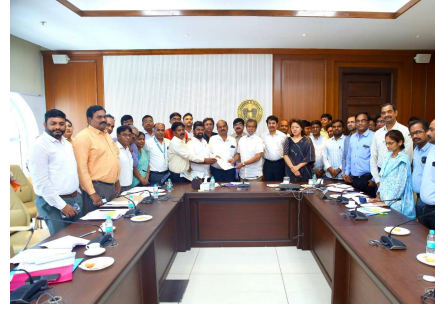
బదిలీల నుంచి మినహాయంపు ఇవ్వాలని, రెండేళ్ల సర్వీస్ ఫూర్తి చేసిన వారికి కూడా బదిలీలో అవకాశం కల్పించాలని విజ్ఞప్తి చేశారు. జిల్లాల్లో పనిచేస్తున్న వైద్యులకు హైదరాబాద్ మెడికల్ కాలేజీల్లోకి బదిలీ అవకాశాలు ఇవ్వాలని కోరారు. దీనిపై స్పందించిన మంత్రి దామోదర్ రాజనర్సింహ, ప్రభుత్వం ఇచ్చిన జీవో ప్రకారమే

హైదరాబాద్, మే. 11, (మెడక్ టుడే న్యూస్) ప్రభుత్వం జారీ చేసిన జీవో 38 ప్రకారం వైద్యుల బదిలీలను పూర్తిగా పారదర్శకంగా నిర్వహిస్తామని ఆరోగ్యశాఖ మంత్రి దామోదర్ రాజనర్సింహ స్పష్టం చేశారు. సోమవారం సచివాలయంలో గవర్నమెంట్ డాక్టర్స్ అసోసియేషన్ ప్రతినిధులతో జరిగిన సమావేశంలో