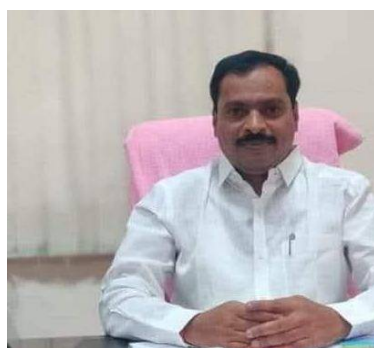
రాజకీయ ప్రయోజనాల కోసం బాలికలపై తప్పుడు కథనాలు ప్రచారం చేయడం కూడా తీవ్రమైన నేరమేనన్నారు. బండి సంజయ్ కుమారుడిపై వచ్చిన ఆరోపణలను పూర్తిస్థాయిలో విచారించి, బాధితురాలి వాంగ్మూలాన్ని న్యాయమూర్తి ఎదుట నమోదు చేయాలని ఆయన కోరారు. కేసును నీరుగార్చే ప్రయత్నం చేస్తే బీఆర్ఎస్ తరపున అందోళ్లను చేపడతామని హెచ్చరించారు. మైనర్ బాలికపై తప్పుడు ప్రచారం చేసిన వారపై చట్టం కఠినమైన రక్షణ