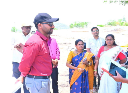
ఆదేశించారు. ధాన్యం తూకం, నిల్వ, రవాణా ప్రక్రియల్లో నిర్లక్ష్యం చూపేసుకోకూడదని కలెక్టర్ హెచ్చరించారు. రాష్ట్రవ్యాప్తంగా ఆకాల వర్షాలు కురుస్తున్న నేపథ్యంలో కొనుగోలు కేంద్రాల్లో గన్నీ సంఘాలు, టార్గెటింగ్ కవర్లు అందుబాటులో ఉంచుకోవాలని సూచించారు. ధాన్యం తడవకుండా తగిన రక్షణ చర్యలు తీసుకోవాలని కేంద్రాల నిర్వాహకులకు తెలిపారు. కొనుగోలు చేసిన ధాన్యానికి వెంటనే డేటా ఎంట్రీ పూర్తి చేసి రైతుల ఖాతాల్లో డబ్బులు త్వరగా జమయ్యేలా చూడాలని కలెక్టర్ అధికారులను ఆదేశించారు. అలాగే మెల్లల వద్ద

జగిత్యాల.మె.మెదక్ టుడే న్యూస్: జగిత్యాల జిల్లాలో వరి ధాన్యం కొనుగోలు ప్రక్రియను వేగవంతంగా, పారదర్శకంగా నిర్వహించాలని జిల్లా కలెక్టర్ బి నత్యప్రసాద్ అధికారులను ఆదేశించారు. సోమవారం మెట్పల్లి మండలంలోని అత్యంత, అత్యవగర్, వెల్లూరు గ్రామాల్లో ఏర్పాటు చేసిన వరి ధాన్యం కొనుగోలు కేంద్రాలను ఆయన ఆకస్మికంగా పరిశీలించారు. కేంద్రాల్లో జరుగుతున్న తూకం, నిల్వ, రవాణా ఏర్పాట్లను పరిశీలించి అధికారులకు పలు సూచనలు చేశారు. ఈ సందర్భంగా కలెక్టర్ మాట్లాడుతూ, కొనుగోలు కేంద్రాలకు వచ్చిన వరి ధాన్యాన్ని మ్యాచర్ వచ్చిన వెంటనే ఆలస్యం చేయకుండా తూకం వేసి మెల్లలకు తరలించాలని స్పష్టం చేశారు. రైతులు ఎలాంటి ఇబ్బందులు పడకుండా సకాలంలో ధాన్యం కొనుగోలు పూర్తిచేయాలని సూచించారు. కొనుగోలు ప్రక్రియలో పారదర్శకత పాటించాలని, రైతులకు పూర్తి స్థాయిలో సేవలు అందేలా చర్యలు తీసుకోవాలని సబంధిత అధికారులను ఆదేశించారు. అలాగే మెల్లల వద్ద