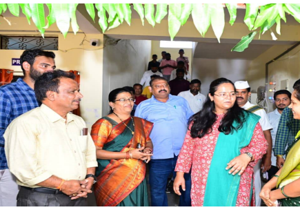
నిధుల ద్వారా కళాశాలలో వివిధ రకాల మౌలిక సదుపాయాల కల్పించడం