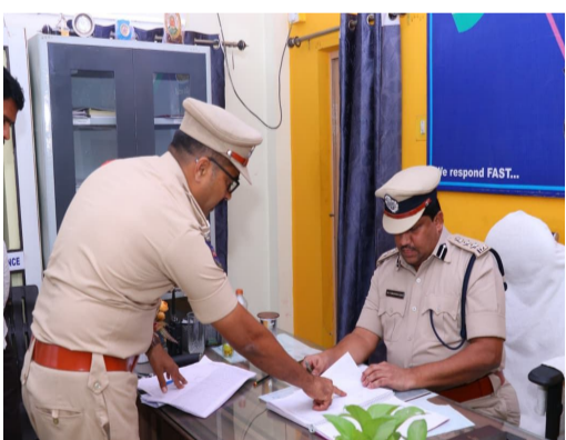
అవగాహన కార్యక్రమాలు నిరంతరం నిర్వహించాలని ఆదేశించారు. ప్రమాదాలు ఎక్కువగా జరిగే ప్రాంతాలను గుర్తించి ప్రత్యేక చర్యలు చేపట్టాలని సూచించారు. స్టేషన్ పరిధిలో ఏర్పాటు చేసిన సీసీ కెమెరాల పనితీరును పరిశీలించిన

జిల్లా వ్యాప్తంగా పోలీస్ స్టేషన్లలో ఆకస్మిక తనిఖీలు నిర్వహిస్తూ, విధి నిర్వహణలో లోపాలు గుర్తించిన అధికారులు, సిబ్బందిపై శాఖాధరమైన చర్యలు తీసుకుంటూ క్రమశిక్షణకు పెద్దపీట వేస్తున్న మెడక్ జిల్లా ఎస్పీ శ్రీ డి.వి. శ్రీనివాసరావు, ఐపీఎస్ శుక్రవారం మెడక్ టౌన్ పోలీస్ స్టేషన్ను ఆకస్మికంగా తనిఖీ చేశారు. ఈ సందర్భంగా స్టేషన్లో నిర్వహిస్తున్న రికార్డులు, పెండింగ్ కేసులు, నేర నియంత్రణ చర్యలు, సిబ్బంది విధి నిర్వహణ తదితర అంశాలను క్షుణ్ణంగా పరిశీలించి అధికారులకు పలు సూచనలు చేశారు. పెండింగ్లో ఉన్న కేసుల వివరాలను సమీక్షించిన ఎస్పీ, వాటి దర్యాప్తును వేగవంతంగా పూర్తి చేసి బాధితులకు త్వరితగతన వ్యాయం అందేలా చర్యలు తీసుకోవాలని అధికారులను ఆదేశించారు. కేసుల విచారణలో నిర్లక్ష్యం లేకుండా సమయపాటున తీర్మానాలు నిర్వహించాలని సూచించారు. రోడ్డు ప్రమాదాల నివారణకు పోలీసులు చేపడుతున్న చర్యలపై ఎస్పీ సమీక్ష నిర్వహించారు. ట్రాఫిక్ నియంత్రణ, డ్రంగ్ అండ్ డ్రైవ్ తనిఖీలు, వాహనదారులకు